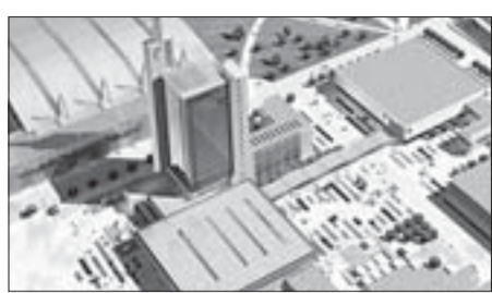
Rechts vom Messe-Hochhaus entsteht der Zehn-Millionen-Euro-Neubau. Computervisualisierung